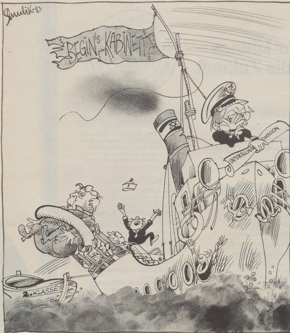
Scharons «Rücktritt» aus der Sicht des israelischen Karikaturisten Shmuel Katz