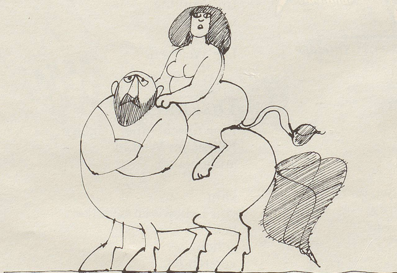
Sphinx auf gutmütigem Kentauren