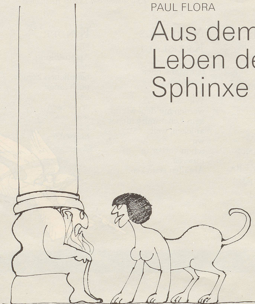
Die boshafte Sphinx