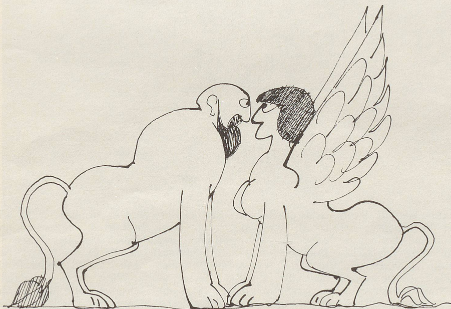
Aug' in Aug'