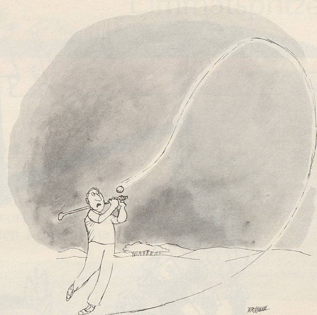
«Nun habe ich schon wieder einen dieser neuen Bumerang-Bälle erwischt!»

Martina Navratilowa gewann in diesem Jahr zwei Grand-Slam-Turniere: Wimbledon und Flushing Meadow: Ob es ihr gelingt, alle vier grossen Turniere zu gewinnen, ist fraglich, trotz ihrer gegenwärtigen Superform. Auch sie rutscht zwischendurch plötzlich mal aus, besonders auf Sand, wie das im Juni in Paris der Fall war. Auch bei ihr ist hie und da das Nervenflattern doch noch grösser als die Stärke ihrer Muskeln. «Lohnen» würde sich ein Grand-Slam-Erfolg schon, hat doch der Internationale Tennisverband eine Million Dollar für den Sieg ausgesetzt. Mit diesem Preisgeld ist der oberste Fachverband diesmal der werbegierigen Wirtschaft zugekommen, nachdem er das Davis-Cup-Roulett an ein japanisches Industrieunternehmen verkaufte und in der Folge – beinahe nichts mehr dazu zu sagen hat. Auch am Sitz des Verbandes in London bekam man zu spüren: Wer zahlt, befiehlt! Speer