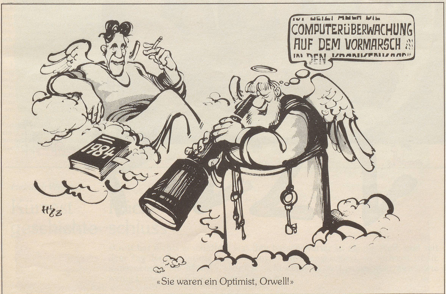
«Sie waren ein Optimist, Orwell!»