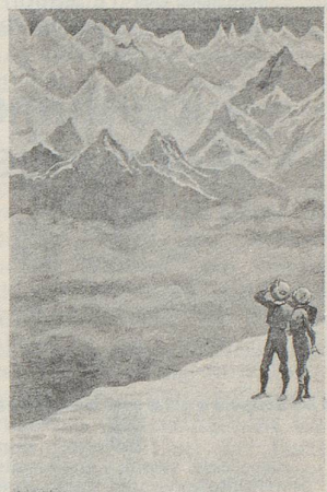
Das junge Ehepaar Fürst besuchte natürlich auch – auf der Hochzeitsreise – die Venus. Belauschen wir die beiden bei ihrem ersten «Rundgang»: «Was für eine Welt, nichts als Schneegipfel und Wolkenmeere, Inseln von Eis und Schnee in einem Nebeloccean! Das ist ja das Berner Oberland, überhaupt die Schweizer Schneeberge hundertfältig!»