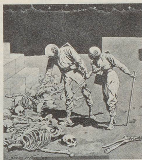
Vor einer «Pyramide aus Millionen gebleichter Knochen und Schädel» erstarren die astronautischen Flitterwöchner bei ihrer Visite auf dem von Gorillas bewohnten Mond.