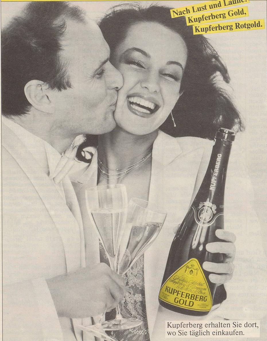
Kupferberg erhalten Sie dort, wo Sie täglich einkaufen.

Nach Lust und Laune: Kupferberg Gold, Kupferberg Rotgold.