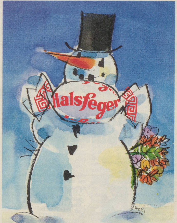
André Klein AG, Neuwelt

E in Finanzmann trifft den andern. «Ich freue mich, Sie endlich einmal wiederzusehen. Gehen wir etwas nehmen!» – «Wem?»