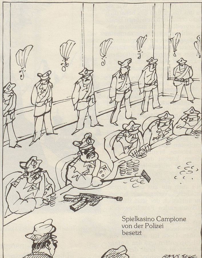
Spielcasino Campione von der Polizei besetzt