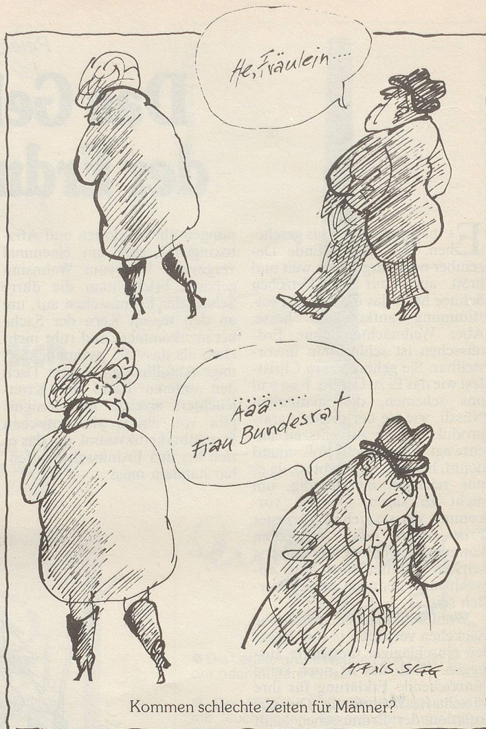
Kommen schlechte Zeiten für Männer?