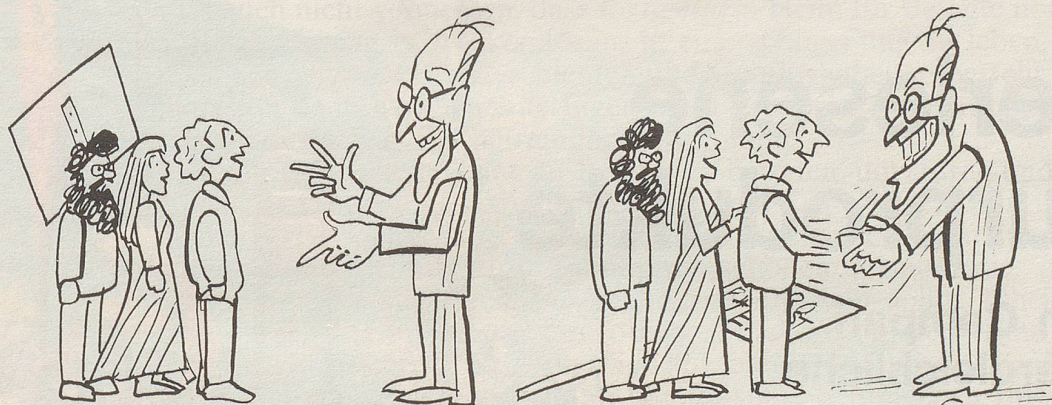
..... sofort die nötigen Massnahmen in die Wege leiten, alle finanzpolitischen, ökologischen, sozialen und militärpolitischen Fäcts hinterforschen, eine Statistik erstellen, ein Exposé ausarbeiten lassen....