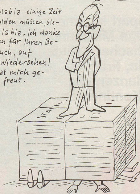
Und wenn Sie noch ein paar Fragen haben sollten, bitte: Ich stehe jederzeit zur Verfügung.