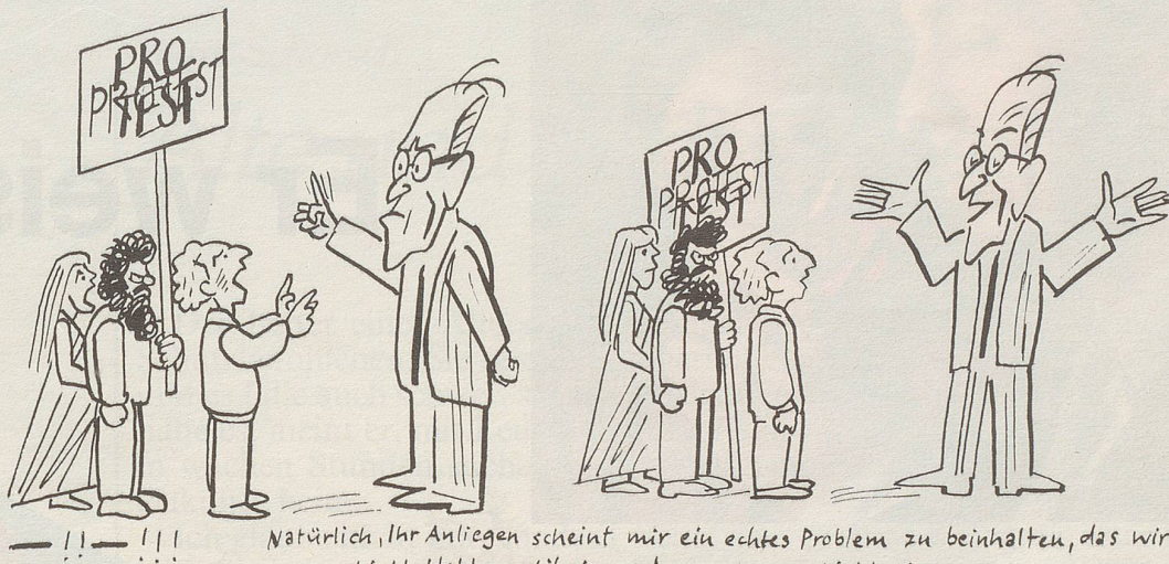
— !! — !!! Natürlich, Ihr Anliegen scheint mir ein echtes Problem zu beinhalten, das wir blablabla radikal angehen müssen blablabla

kann jedermannfrau seine Anliegen auf echt demokratischem Weg vorbringen.