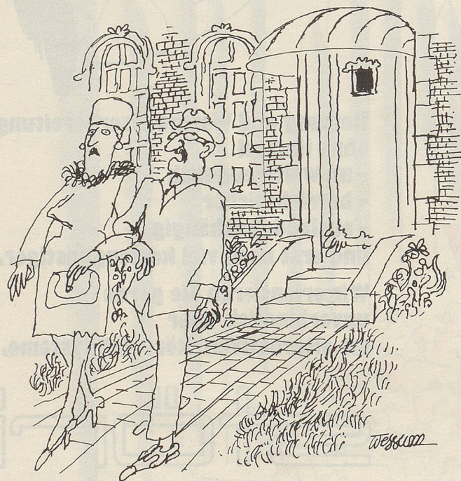
«Das sind Snobs: Hummer im Gartenteich!»

Ich fange an, mich zu schämen, aber nur ein bisschen, denn schliesslich schleppe ich die Papiermengen vom Estrich herunter, bündle sie und stelle sie an den Strassenrand! Uschi