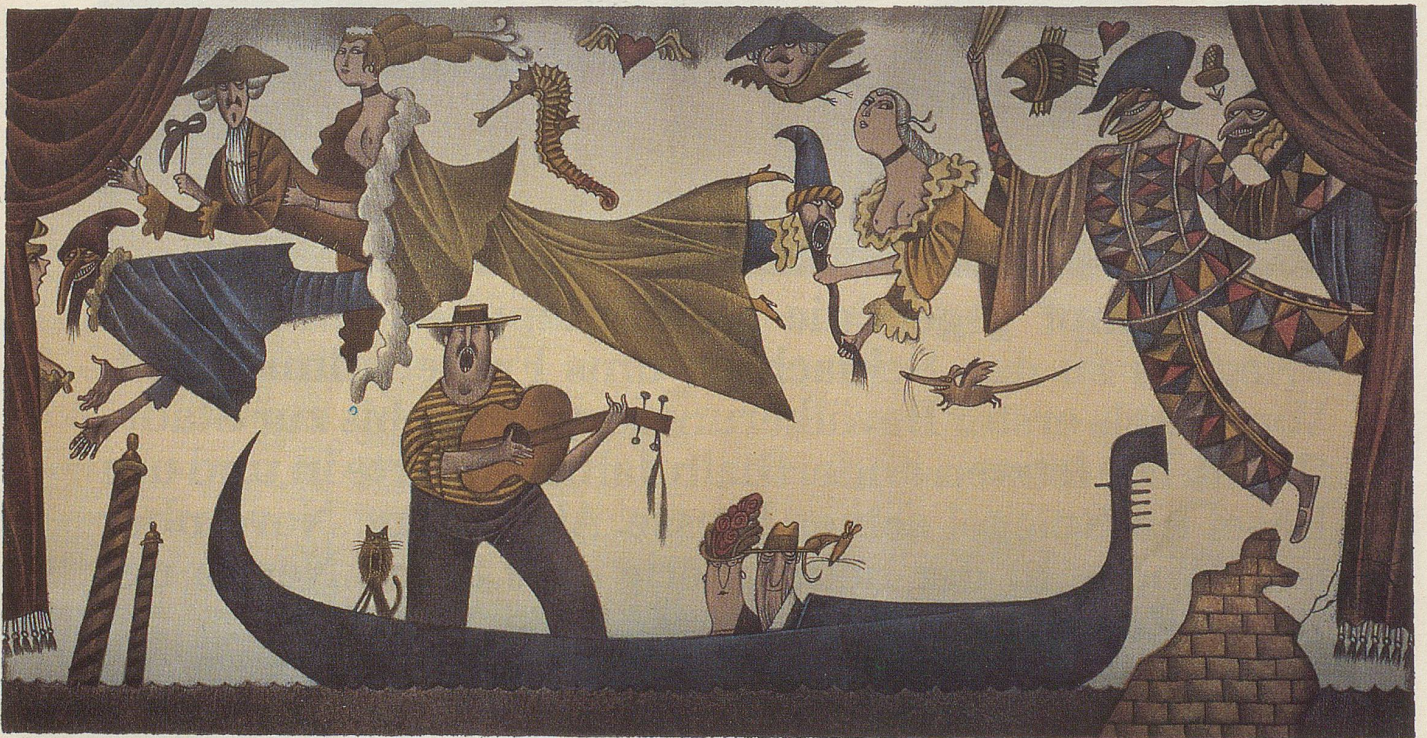
Adolf Born: Ausflug nach Venedig