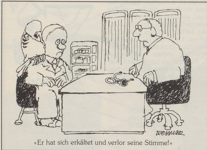
«Er hat sich erkältet und verlor seine Stimme!»

Er ruhte nicht, bis er eine namhafte Persönlichkeit war, und wunderte sich dann, dass er bei seinem Namen behaftet wurde.