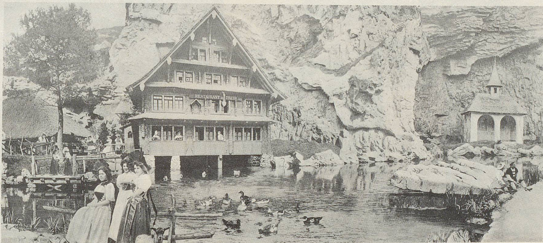
Das Restaurant du Treib samt Imitations-Vierwaldstättersee und anschliessender Telskapelle, flankiert von gänsehütenden Trachtenmeitschi – das war die Schweizer Sensation in Paris vor 83 Jahren!