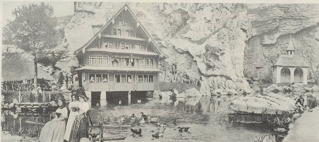
Das Restaurant du Treib samt Imitations-Vierwaldstättersee und anschliessender Tellskapelle, flankiert von gänsehütenden Trachtenmeitschi – das war die Schweizer Sensation in Paris vor 83 Jahren!