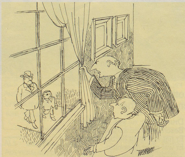
«Es ist doch nicht der Sohn des Steuerkommissärs, von dem du gesagt hast, du hättest ihn eben verprügelt?»

Ende Jahr werde ich Bilanz ziehen müssen.