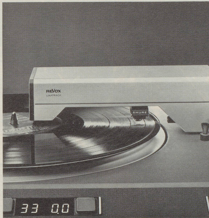
Schwenkarm und Abtastsystem der Revox Tangentialplattenspieler B 791 und B 795.