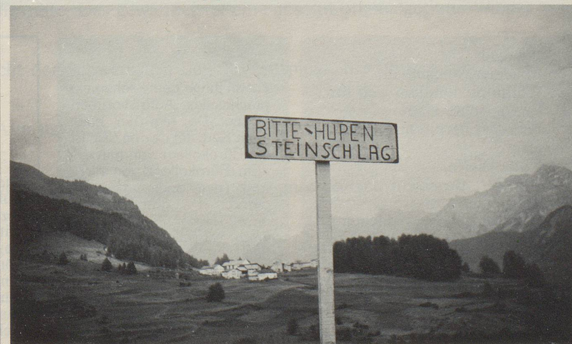
Also zu lesen im Unterengadin!