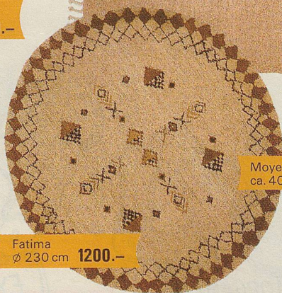
Fatima Ø 230 cm 1200.-