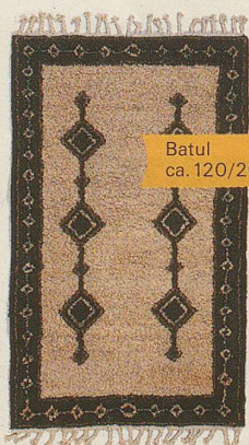
Batul ca. 120/200 cm 420.-