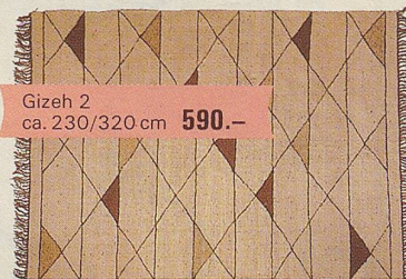
Gizeh 2 ca. 230/320 cm 590.-

Alle Preise sind Mitnahmepreise. Jeder Teppich ist ein Einzelstück. Wenn er verkauft wird, finden Sie bei uns aber ebenso schöne Stücke in ähnlicher Grösse und Preislage.