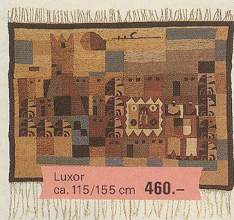
Luxor ca. 115/155 cm 460.-

Und wenn wir schon in Nordafrika sind, sollen Sie auch einen handgewobenen Bildteppich aus unserem originellen Angebot ägyptischer Handwebteppiche kennenlernen.