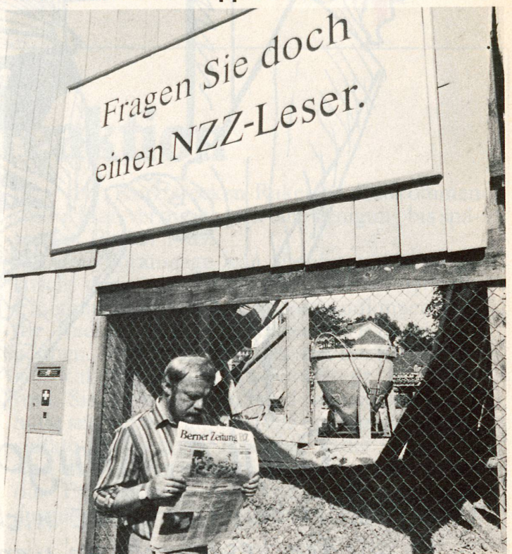
Bern bleibt Bern ...