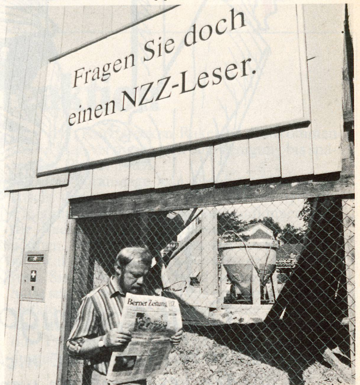
Bern bleibt Bern ...