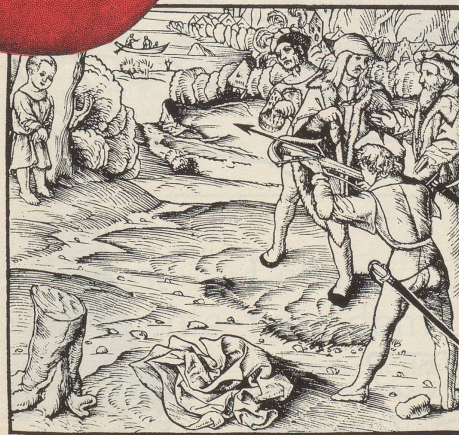
Im Jahr des Apfelschusses soll sich die Urschweiz der Ernte besonders grosser Äpfel erfreut haben. (Gemäss Randvermerk eines zeitgenössischen Chronisten.)