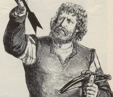
Aufstellung des Weltrekords im 13. Jahrhundert. (Eintragung im damaligen Guinness-Book der Rekorde)