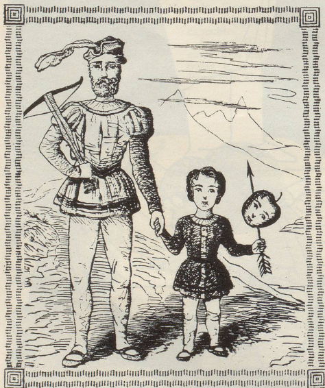
Die Schreckensvision des Walterli Tell. (Das von der Literatur nur unzureichend bewältigte Jugendtrauma des Tellensohnes.)