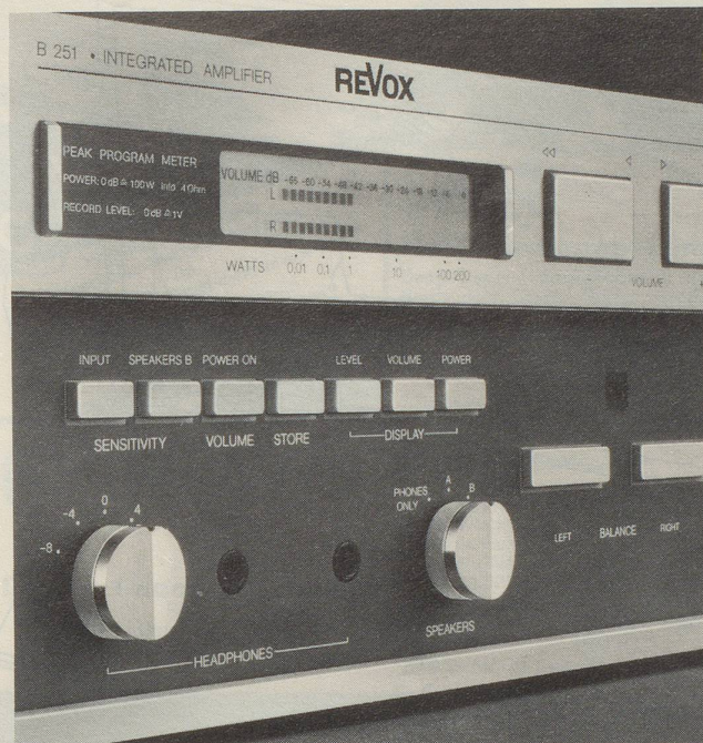
Der neue Vollverstärker B 251. Spitzendaten, Bedienungskomfort und Exklusivität im Weltklasseformat.