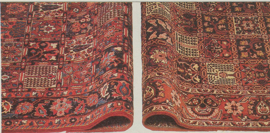
Im Bild links sehen Sie einen Detailausschnitt eines klassischen persischen Bachtir. Das Bild rechts zeigt eine indische Nachknüpfung eines Bachtir. Trotz ähnlicher Knüpf- und Farbqualität sind indische Bachtirs aber wesentlich günstiger.