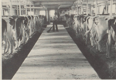
4 ... und dass sie die Zeit im stickigen Stall nur glücklich überstehen ...