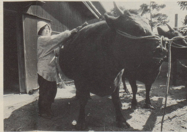
8 ... und mehr Streicheleinheiten, als mancher Landwirt ahnt.