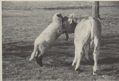
7 Unser Vieh braucht im übrigen mehr Zärtlichkeit ...