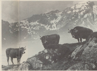
2 Obwohl in Helvetien allgegenwärtig, ist unser Nationaltier im Grunde genommen ein unbekanntes Wesen geblieben.