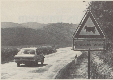
1 Was wäre die Schweiz ohne Kühe?