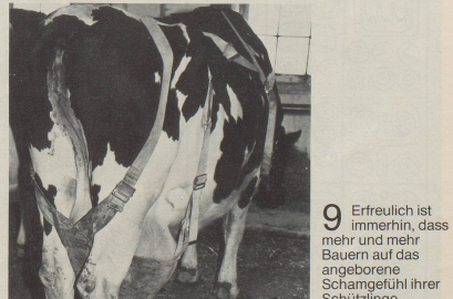
9 Erfreulich ist immerhin, dass mehr und mehr Bauern auf das angeborene Schamgefühl ihrer Schützlinge gebührend Rücksicht nehmen.