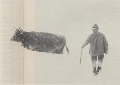
5 ... wenn sie regelmässig frische Luft schnappen können.