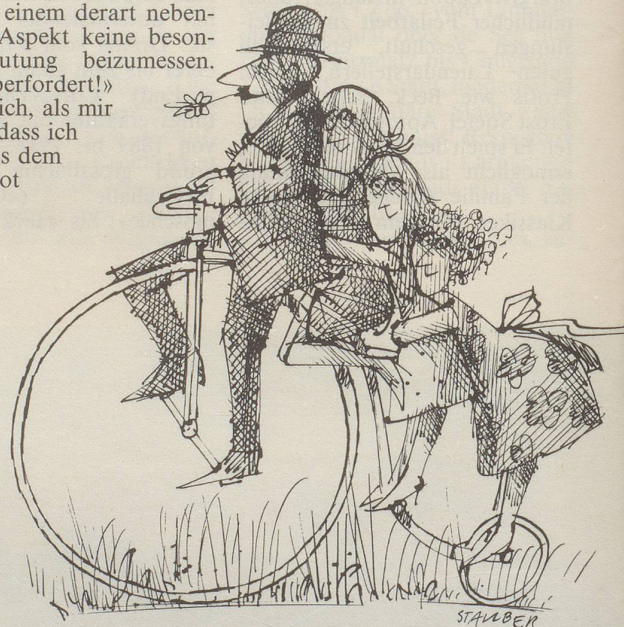
Es ist Frühling!

nicht verstand. Zum Exempel rätsle ich noch immer, ob mir in Form des halbfränkigen «Break-Halters» ein Hit entgangen ist – nur, weil ich das Fremdwörterbuch nicht fand. Bei den «exklusiven Holz-Kleiderbügel» hätte ich sofort auf Kauf! schalten müssen, denn sie waren «mit Ihren persönlichen Initialen in Gold geprägt!» zu haben. Und zehn Stück «(Mindestbezug)» kosteten lediglich Fr. 49.–. So günstig komme ich nie wieder zur «Visitenkarte der Hausfrau!». Und schon gar nicht zu edlem Material, das ich mir bei Bedarf als Teakbrettersatz vor den Kopf schrauben kann.