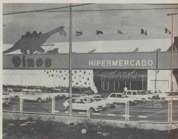
⑤ Wenn das nicht Galgenhumor ist: Einen Hypermarkt «Dinos» zu nennen nach den Dinosauriern, die wegen ihrer Übergrösse ausgestorben sind ...

Von einer vorösterlichen Blitzvisite an der Costa Blanca hat Nebi-Mitarbeiter öft diese Schnappschüsse mitgebracht und sich nachträglich ein paar Gedanken darüber gemacht. Bemerkung zum Titel: Ausrufe und Fragen werden in Spanien vorne (verkehrt) und hinten mit je einem Ausrufe- oder Fragezeichen versehen.