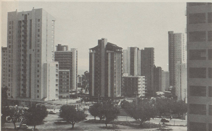
① Genau wie es der Prospekt versprach: Aussicht aufs Meer!