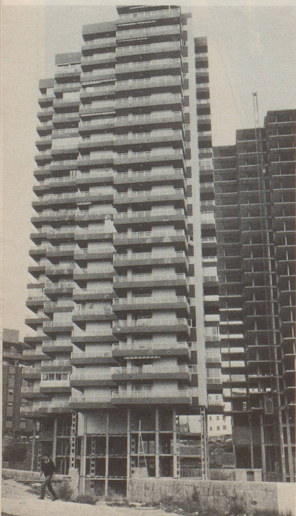
④ Bei diesem zwanzigstöckigen Spekulantenbau, wie sie auch an der Costa Blanca nur so aus dem Boden schiessen, scheinen sich die Architekten über das Parterre noch nicht einig zu sein.