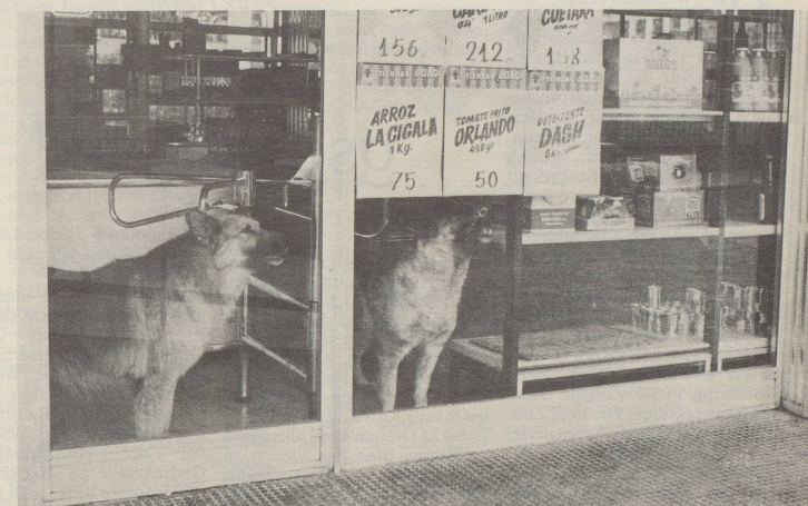
③ In einem Supermarkt, in den Hunde auch in Spanien aus hygienischen Gründen gar nicht hineindürften, blecken nur zwei Hunde die Zähne – am Sonntag als Wächter eingesperrt!