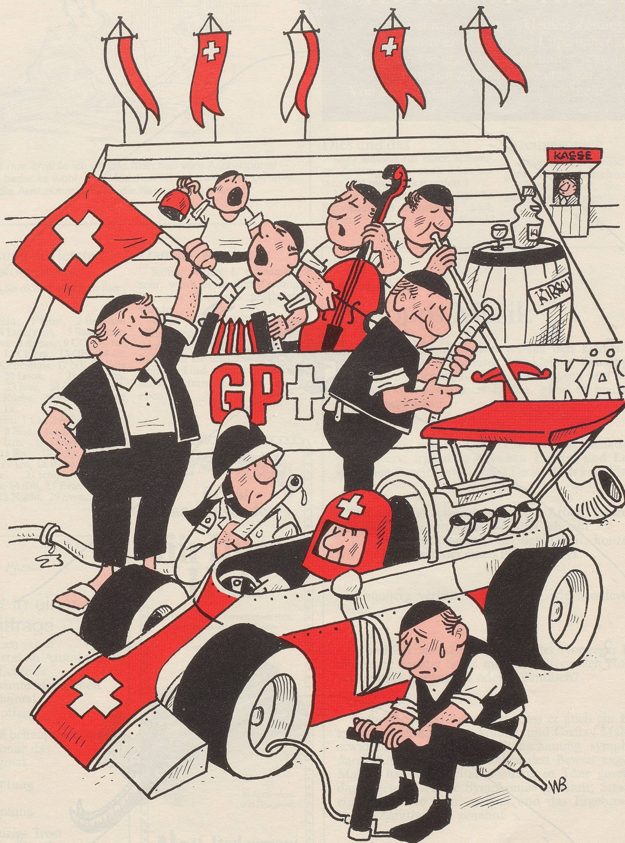
Grand-Prix Schweiz fern der Heimat