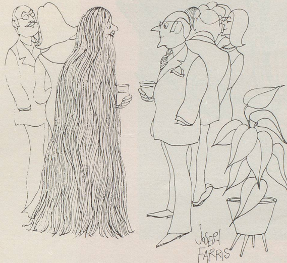
«Damit spare ich erheblich: Coiffeur, Hemd, Krawatte, Jacket und Hose ...»