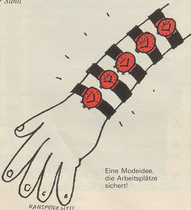
Eine Modeidee, die Arbeitsplätze sichert!