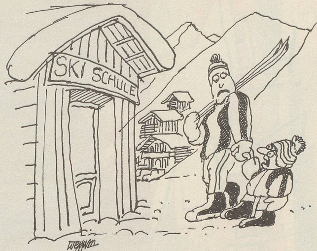
«In die Schule? Während der Winterferien?»

Auf die Frage, ob sie noch nie gesundheitliche Schwierigkeiten gehabt hätten, meinte ein Senior: «Bei denen, die regelmässig kommen, gab es noch nie gesundheitliche Probleme. Durch das Weitermachen nach der Hochleistungsperiode (die meisten Mitglieder spielten früher in einer der oberen Ligen) bleibt der Körper immer in einer guten Verfassung, d.h., der Organismus ist es gewohnt, physische und psychische Belastungen zu verkraften. Unregelmässigkeiten treten dann auf, wenn einer nur sporadisch zum Training kommt oder glaubt, ohne regelmässiges Training hie und da ein Wettspiel bestreiten zu können. Gerade deshalb trainieren wir auch den ganzen Sommer