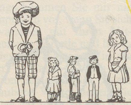
Stadtfreie I II III IV V

Eidgen. Volkszählung vom 18. bis 25. März