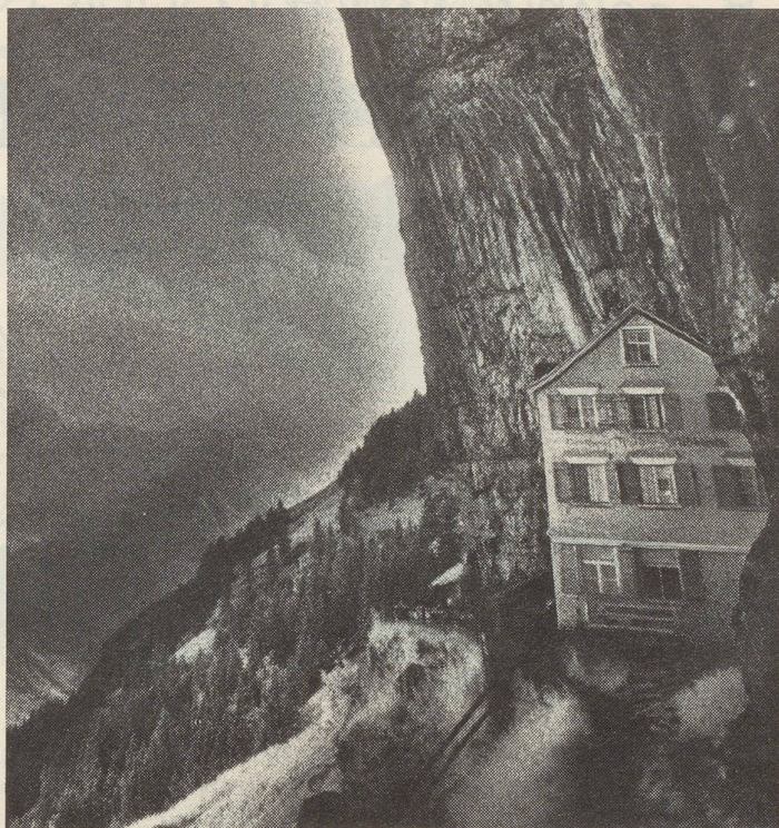
UKW-Empfang in Europa verlangt von einem Empfänger schon Revox-Qualitäten.