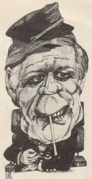
Ohne Prinz-Heinrich-Mütze wäre aus mancher Karikatur Helmut nicht als Schmidt erkennbar. Und vielleicht ging es einst Prinz Heinrich mit seiner Mütze wie Winston Churchill mit seinem Hut.

Würde Ihnen das nicht Arger und Kummer bereiten? Schliesslich können Sie doch nicht herumgehen und allen Betrachtern sagen: «Diese Karikatur ist nicht wahrheitsgetreu; sie ist nicht richtig; sie ist nicht fair. Meine Nase ist nicht so; mein Hut ist nicht so klein; schauen Sie ihn an, sehen Sie, Sie können ihn auf Ihren eigenen dicken Kopf setzen. Ist er nicht gross genug?» Oder: «Ich war bei dieser Gelegenheit nicht in einer lächerlichen Situation. Ich handelte aus edlen Motiven und auf Grund ernsthafter Überlegungen. Lesen Sie meine Rede vom sechszwanzigsten Januar vor drei Jahren, dann werden Sie sehen, auf welchem Standpunkt ich stehe. Und ich habe nicht den kürzeren gezogen. Im Gegenteil, auf die Dauer setzte sich die Gerechtigkeit durch, und ich triumphierte.» O nein, das können Sie nicht tun. Sie können nie nachkommen. Sie können diese ersten