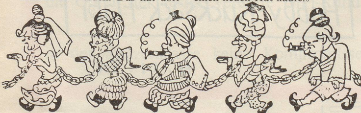
In einer Karikatur von Poy aus dem Jahre 1931: britische Politiker, äusserlich orientiert, anlässlich einer Ausstellung in London über Meder und Perser. Rechts aussen Churchill in seiner «karikaturistischen Übergangsphase»: Noch wird er kenntlich gemacht durch das legendäre Hütchen, schon aber trägt er auch das neue Merkmal: die unvermeidliche Zigarre.