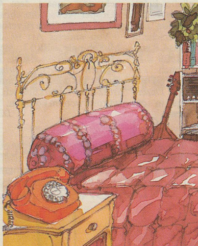
Ein oranger Zweitapparat auf dem Nachttisch für entspannte Zwiesgespräche.

Weitere Auskünfte über einen zweiten Telefonapparat gibt Ihnen jeder konzessionierte Telefoninstallateur oder die Kreisteledirektion (Nr. 113).