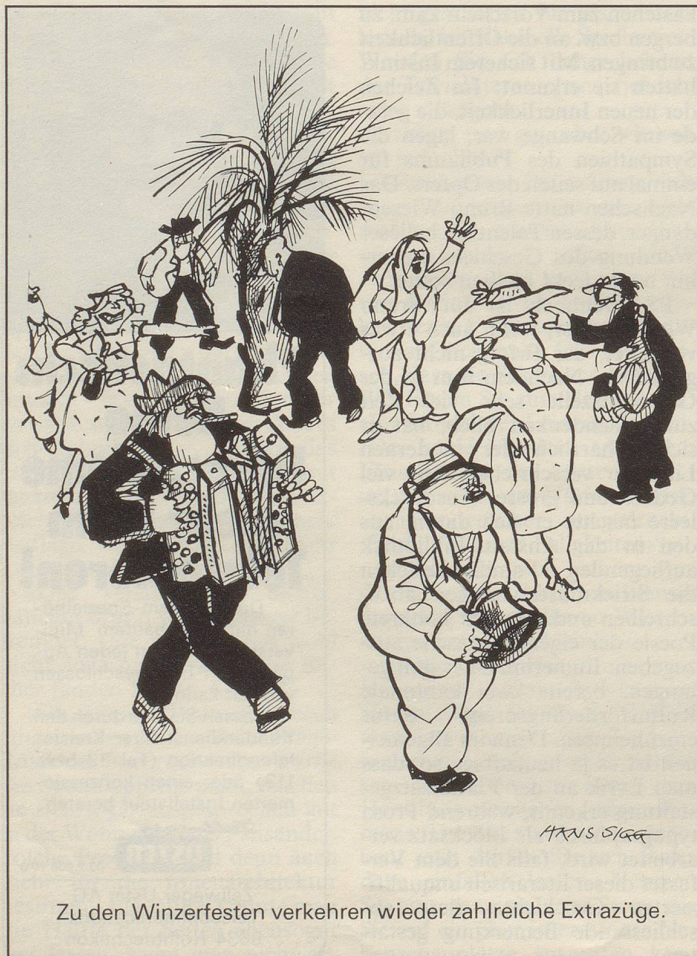
Zu den Winzerfesten verkehren wieder zahlreiche Extrazüge.