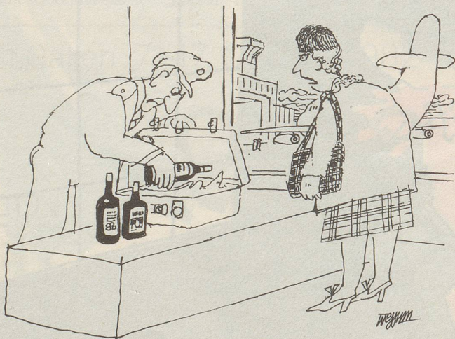
«Ich sagte Ihnen ja, ich hätte nur einige Souvenirs aus Schottland!»