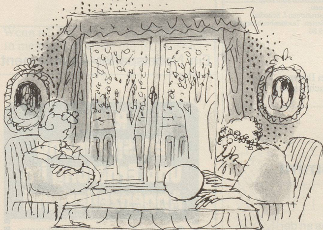
«... und da sehe ich – aber nicht vor 1986 – eine Veränderung in der Steuergesetzgebung!»

Sohn zum Vater: «Hier hast du deine Steuererklärung. Sie ist fertig ausgefüllt! Und wie weit bist du mit meinen Schulaufgaben gekommen?»