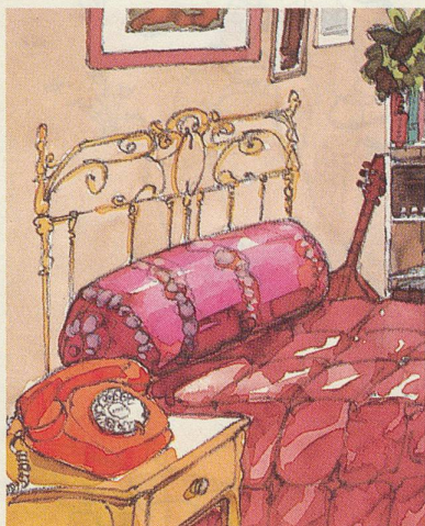
Ein oranger Zweitapparat auf dem Nachttisch für entspannte Zwiegespräche.

Weitere Auskünfte über einen zweiten Telefonapparat gibt Ihnen jeder konzessionierte Telefoninstallateur oder die Kreisteledirektion (Nr. 113).