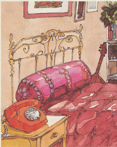
Ein oranger Zweitapparat auf dem Nachttisch für entspannte Zwiesprache.

Weitere Auskünfte über einen zweiten Telefonapparat gibt Ihnen jeder konzessionierte Telefoninstallateur oder die Kreistelefondirektion (Nr. 113).