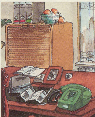
Ein grünes Tastentelefon im Arbeitszimmer für ungestörte Gespräche trotz Fernsehen oder Besuch.