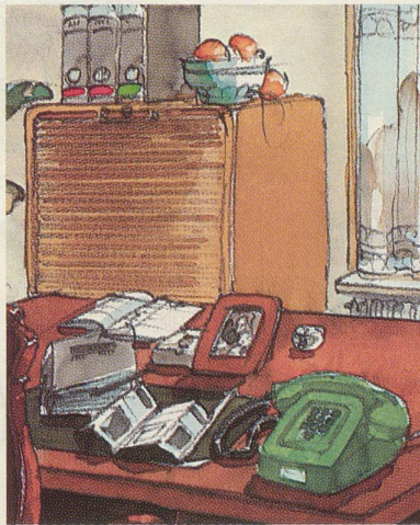
Ein grünes Tastentelefon im Arbeitszimmer für ungestörte Gespräche trotz Fernsehen oder Besuch.