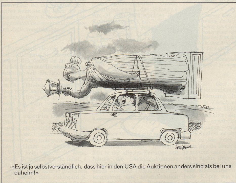
«Es ist ja selbstverständlich, dass hier in den USA die Auktionen anders sind als bei uns daheim!»

1 4 6 9 12 16 18 21 24 27 29 32 2 5 7 10 13 17 19 22 25 28 30 33 3 8 11 14 20 23 26 31 FS 15