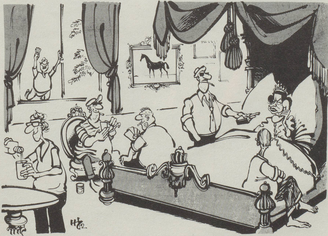
«Philip, hast du eine Ahnung, ob unser Hauspersonal streikt?»