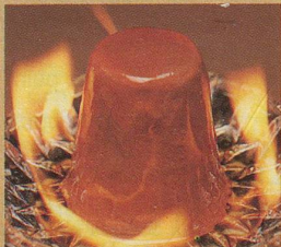
Frisco Parfait Mocca Anzünden und Feuer fangen für den unvergleichlichen Glace-Spass.

Sultaninen ein kräftiges Aroma und dem Entdecker einen Hauch aus der Karibik auf die Zungenspitze. Dieses Erlebnis ist zu schade, um alleine genossen zu werden. Iglou Jamaïque. Die einzige Rumsultaninensauce mit Frisco-Glace drumherum.