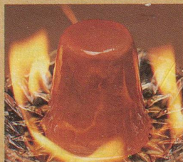
Frisco Parfait Mocca Anzünden und Feuer fangen für den unvergleichlichen Glace-Spiss.

Sultaninen ein kräftiges Aroma und dem Entdecker einen Hauch aus der Karibik auf die Zungenspitze. Dieses Erlebnis ist zu schade, um alleine genossen zu werden. Iglou Jamaïque. Die einzige Rumsultaninensauce mit Frisco-Glace drumherum.