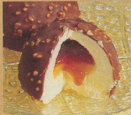
Iglou Caramel Knusprige Schale, süßer Kern. Eine Frisco Spezialität.