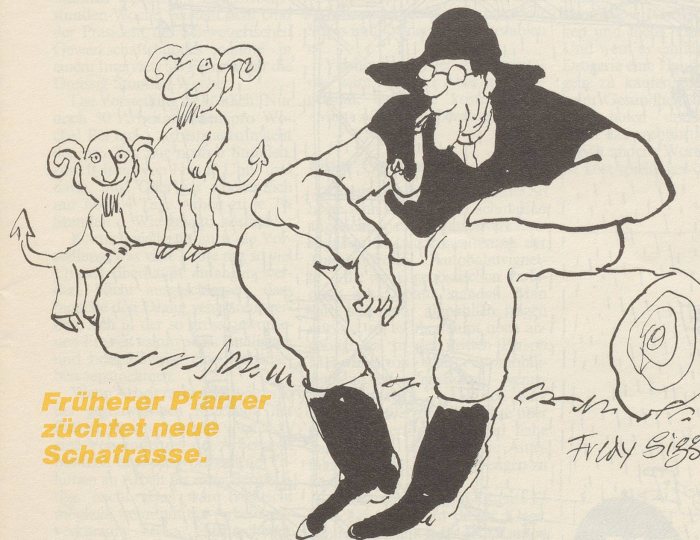
Früherer Pfarrer züchtet neue Schafrasse.