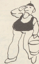
Ex-Divisionär beim Abendappell.