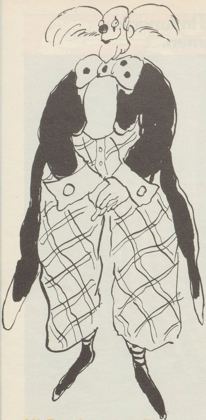
Alt-Bundesrat stellt noch immer rote Fliege zur Schau.

Aber aus der eigenen Haut steigt keiner.