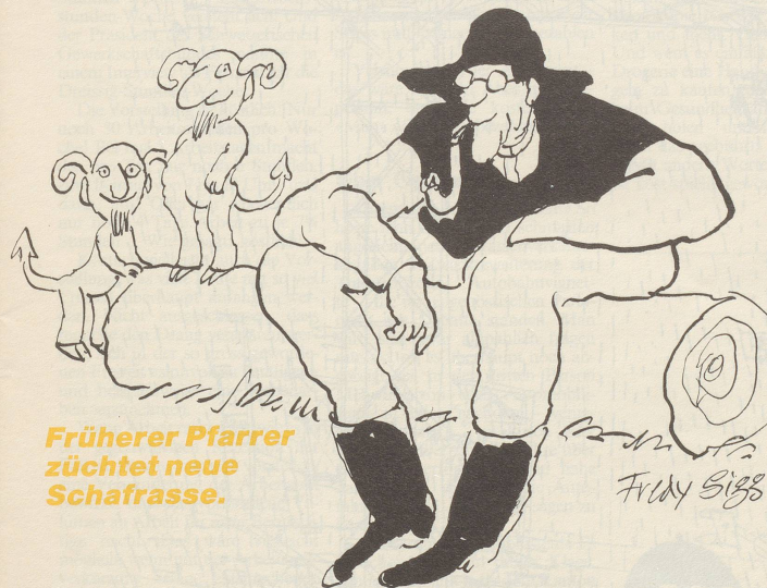
Früherer Pfarrer züchtet neue Schafrasse.