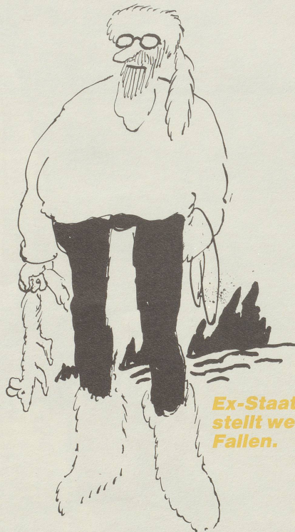
Ex-Staatsanwalt stellt weiterhin Fallen.