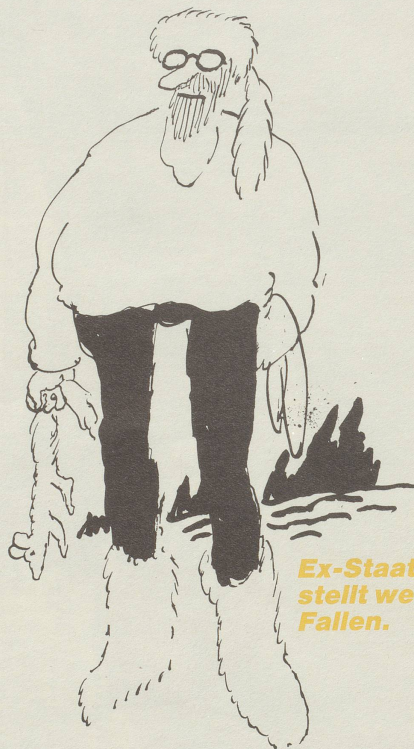
Ex-Staatsanwalt stellt weiterhin Fallen.