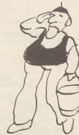
Ex-Divisionär beim Abendappell.