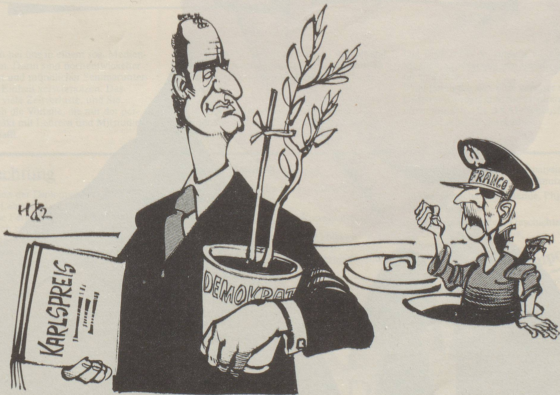
« Du Versager! »