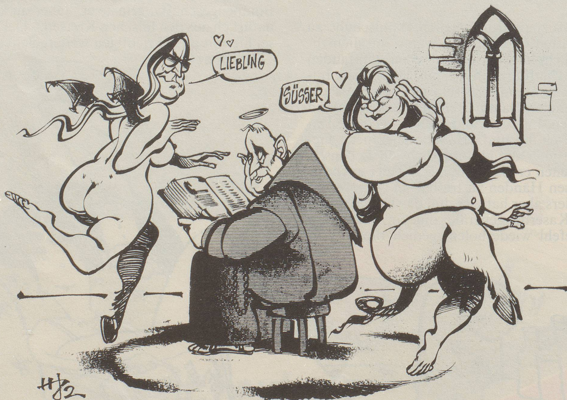
Die (ständige) Versuchung des heiligen Hans-Dietrich