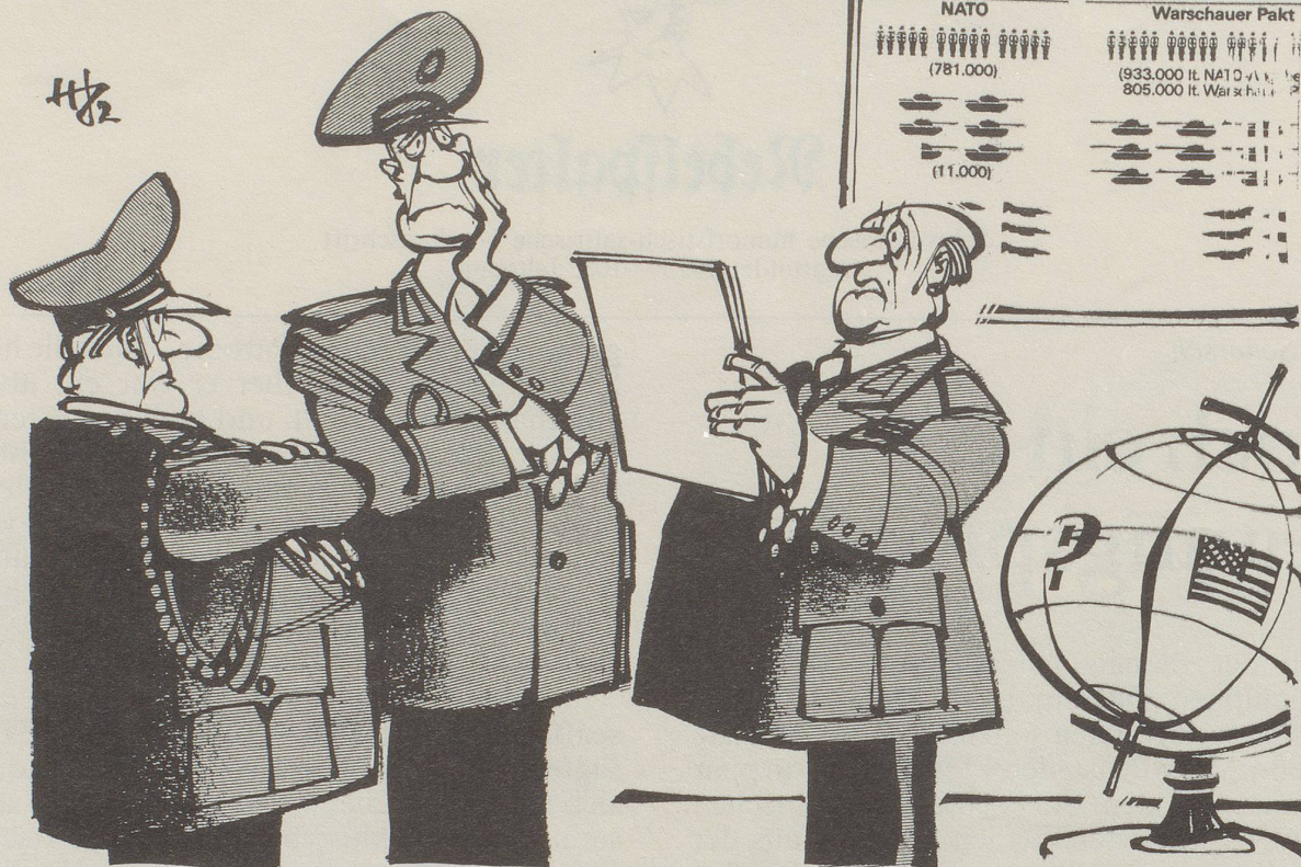
«Die Gegenseite geht auf unseren Abrüstungsvorschlag ein, was haben wir denn da falsch gemacht?»