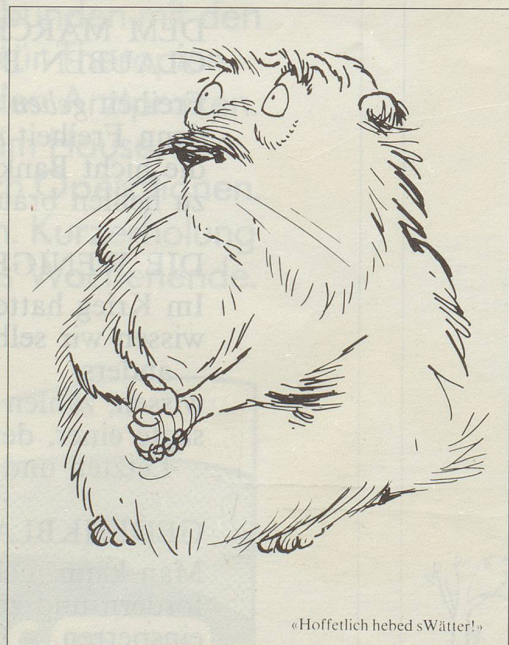
«Hoffentlich hebed s'Wätter!»