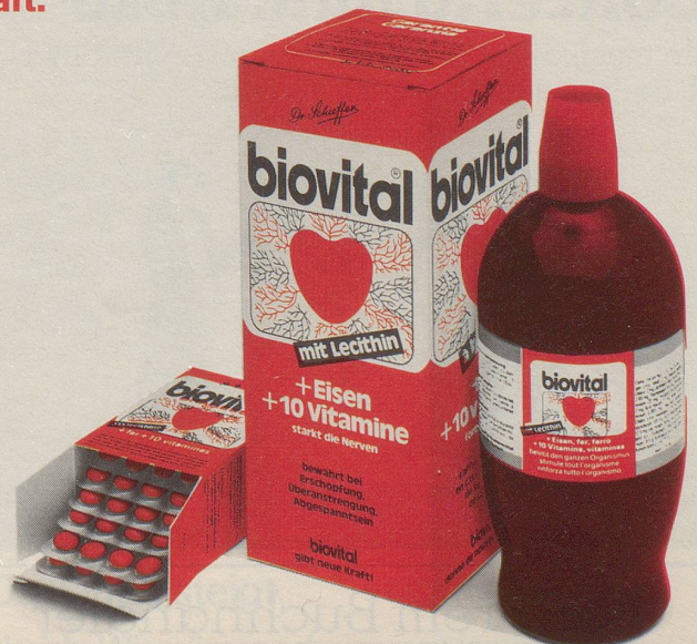
Zut • Arnold

Biovital enthält 10 lebenswichtige Vitamine, biologisch-aktives Eisen und rein pflanzliches Lecithin. Alles in wohlausgewogenen Mengen. ● Deshalb gibt Biovital neue Kraft. Es hilft bei allgemeiner Müdigkeit und Erschöpfung. Bei Appetitlosigkeit, Konzentrationsschwäche und Nervosität. ● Sie bekommen Biovital in allen Apotheken und Drogerien. Als Biovital flüssig und in der praktischen Dragéeform. ● Biovital gibt neue Kraft.