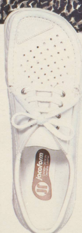
360 JACODOC nur in weiss