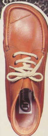
400 JACOTRAMP Mit echter Kalbsleder- fütterung. Naturbraun