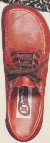
330 ELEGANT rostrau schwarz weiss