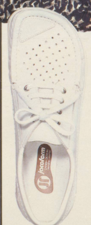
360 JACODOC nur in weiss