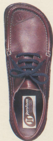
350 RUSTIKAL burgund naturbraun, dunkelbraun schwarz, weiss, marineblau mit weisser Sohle

durch Verzicht auf unnötigen Ballast. Gewicht unter 400 g (Größe 42)