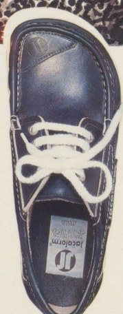
350 RUSTIKAL der Bootsschuh marineblau mit weißer Sohle