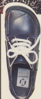
350 RUSTIKAL der Bootschuh marineblau mit weisser Sohle