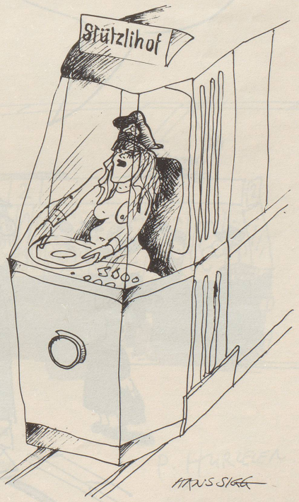
Im Zuge der Entwicklung