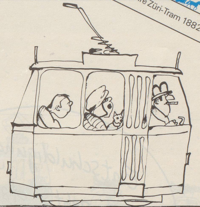
Die Privatisierung der VBZ