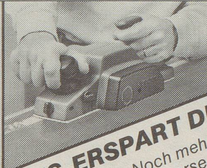
Türen kürzen, schnell und mühelos