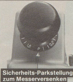
Sicherheits-Parkstellung zum Messerversenken