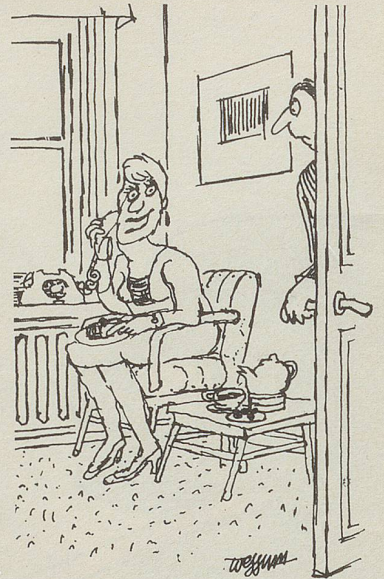
«Sie haben die Fabrik besetzt. Unsere Tochter hat die Telefonzentrale fest in der Hand!»

krug stehen, das Tablett liegen. Sie eilt zum Kleiderschrank, reisst ihr Cape heraus, wirft es sich über die Schultern, nimmt im Eingangstürrahmen Haltung an, spricht mit erhobener Stimme: