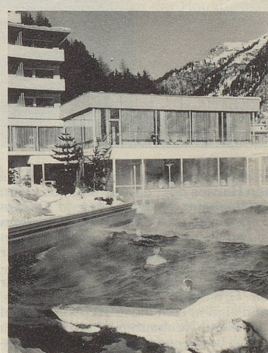
Thermal-Mineral-Wellenfreibad Kurhotel Terme, Bad Vals GR

1 Wochenende Halbpension für 1 Person im Hotel Terme Bad Vals, Standard-Kategorie