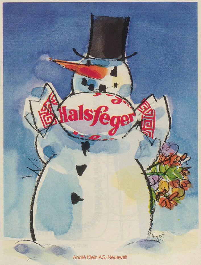
André Klein AG, Neuwelt

Inserat ausschneiden und einsenden an: ELCALOR-Informationsdienst, 5001 Aarau, 064 - 22 36 91